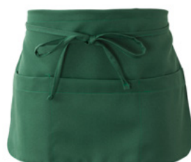
Z49 Verde scuro